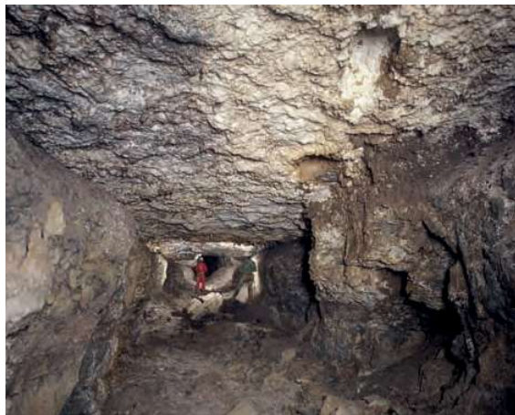
Sistema Ojácano Anjana. N. superior.

Decidiéndonos por la vía Calseca, a esta localidad de Ruesga se llega desviándonos a la izquierda unos 300 m antes de alcanzar San Roque de Riomiera, en la carretera que se dirige al Portillo de Lunada. La subida hasta Calseca, que puede hacerse en coche, cuenta con una bifurcación de la que hay que tomar el ramal izquierdo (el derecho se dirige a Valdició).